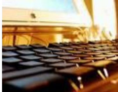
تصویر ۱-۲. یک تصویر

گاه برای نشان دادن یک دستگاه، شیء یا رویداد، تنها از عکس می‌توان کمک گرفت. هرگاه جزء خاصی از عکس مورد نظر است، باید به‌گونه‌های تهیه شود که اجزای فرعی چشمگیرتر از جزء مورد نظر نباشد (شکل ۱-۲).