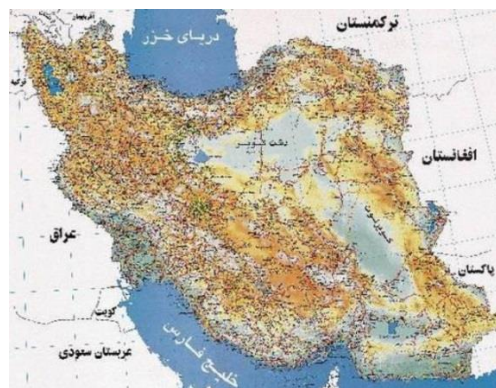
نقشه ۱-۲. نقشه ایران

باید تا حد امکان از به‌کاربردن صفحه‌های بزرگ مانند نقشه‌ها در پروژه‌های نهایی خودداری شود و آنها را از طریق رونوشت‌های (فتوکپی‌های) مخصوص در اندازه تعیین شده تهیه کرد. در صورت لزوم باید به‌دقت صفحه مورد نظر را داخل پروژه نهایی طوری تا نمود که لبه آن از دیگر صفحه‌ها بیرون نزنند.